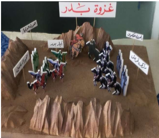
الطالب : أحمد أنور الصف : 3A