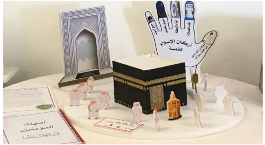
الطالب : أحمد مبارك الهرشاني الصف : 2A