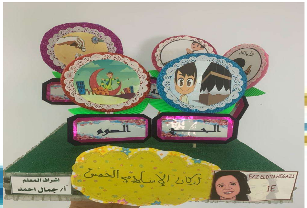
الطالب : عز الدين حجازي الصف : 1E